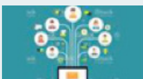
Call for participation