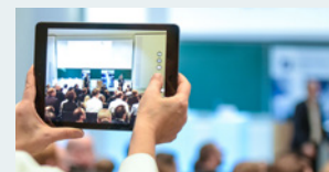
The VOICE of the NEXT GENERATION

Ideenlandkarte, Google Tools, IR-Körperanalyse, Gesundes Trinken mit Smoothie Theke und weiteren Überraschungen