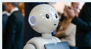
Kreativpause & Interaktionsplattform

mit Gelegenheit für Statements und Fragen aus dem Publikum