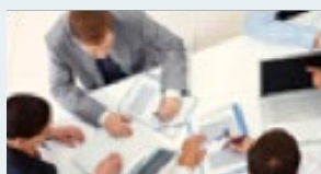
Umfragen & Q&A

mit namhaften Fachleuten und „branchennahen“ Verantwortlichen