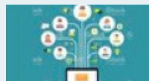
Call for participation

Lassen Sie den Konferenztag Revue passieren, vertiefen Sie die Gespräche und knüpfen Sie wertvolle Kontakte.