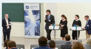
Keynote-Vorträge und Diskussionsrunde

mit namhaften Fachleuten und „branchennahen“ Verantwortlichen