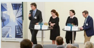
Keynote-Vorträge und Diskussionsrunde

mit namhaften Wirtschaftsvertretern und „branchennahen“ Verantwortlichen