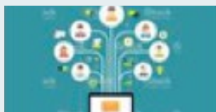
Call for papers

mit namhaften Wirtschaftsvertretern und „branchennahen“ Verantwortlichen