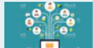
Call for participation

Lassen Sie den Konferenztage Revue passieren, vertiefen Sie die Gespräche und knüpfen Sie wertvolle Kontakte.