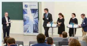
Keynote-Vorträge und Diskussionsrunde

mit namhaften Fachleuten und „branchennahen“ Verantwortlichen